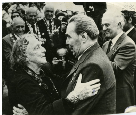
Генеральный секретарь Центрального комитета коммунистической партии Советского Союза Леонид Брежнев встречается с представителями грузинской партийной и культурной элиты.

«Британское правление укрепилось тем, что создало новые классы и сеть взаимных интересов, которая связывала между собой это правление и тех, чьи привилегии зависели от его сохранения».