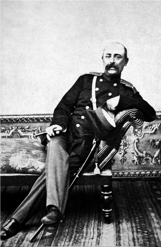
ვახტანგ ვახტანიას ძე ორბელიანი