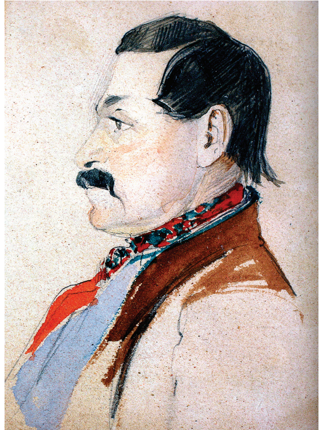
ალექსანდრე ვახტანგის ძე ორბელიანი

ნულარ მიგაჩნდებათ თავი. შენი ცოლშვილებისთვის (ალექსანდრეს მიმართვას – თ. ჯ.) შენ ნულარას ინაღვლი. მე იმათი მომვლელი და პატრონი ვიქნები, ოღონდ რაც უბედურება მოგადგესთ, მოთმინებით მიიღეთ. კარგი. ნადი. ღვთისათვის მიმიბარებიხართ ერთობ თქვენა“.