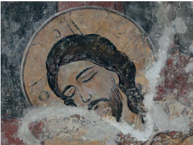
ხობის ტაძრის მხატვრობის დეტალი

ამ ეპოქის ძეგლებს შორის ყველაზე ადრეული გელათის ტაძრის სამხრეთ მინაშენია დავით ნარინის პორტრეტული გამოსახულებებით. პალეოლოგოსურ სტილს მიეკუთვნება ასევე ხობის, მარტვილის, გარზმის მოხატულობები, ქართველი