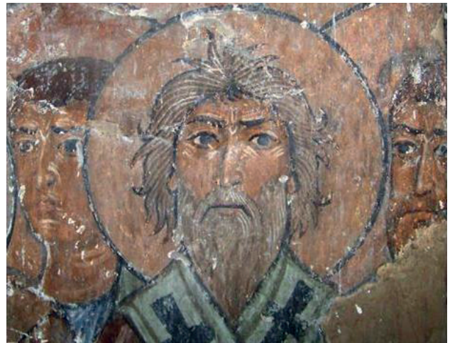
ათენის სიონის მოხატულობის დეტალი

თვალსაზრისით საქართველოში რამდენიმე განსხვავებული მხატვრული სკოლა ჩამოყალიბდა. სავსებით გასაგებია, რომ ერთიანი მხატვრული სტილი ვერ ჩამოყალიბდებოდა იმ ქვეყანაში, რომელიც პოლიტიკურად გაერთიანებული არ იყო. ამ სკოლების წარმომადგენელთა მიერ