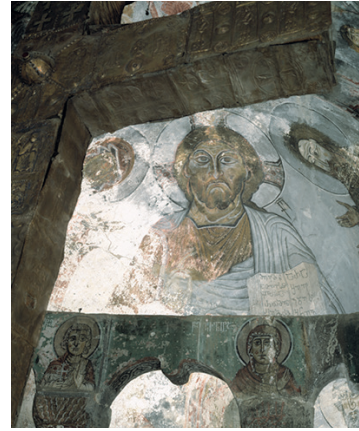
დაბურკას ეკლესიის მოხატულობა

ამ პერიოდის სვანური მხატვრობის უმნიშვნელოვანესი ძეგლებია მეფის მხატვარ თევდორეს მიერ სხვადასხვა დროს შესრულებული იფარის (1096), ლაგურკასა (1112) და ნაკიფარის (1130) დარბაზული ტიპის ეკლესიების მოხატულობა, ასევე მიქაელ მაღლაკელის მიერ მოხატული