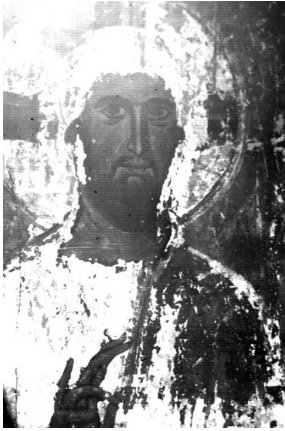
ხახულის ტაძრის დაპარბული ფრესკის დედალი

მოზაიკა (1125-1130 წწ.), რომელიც ამ დარგის კლასიკური ნიმუშია.