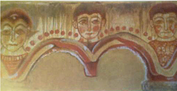
არმაზის წმ. გიორგის ტაძრის კანკელი

რომელიც აღარ გამოირჩევა პლასტიკურობითა და მოქნილობით, არამედ უხეში და კუთხოვანია. ირღვევა ფიგურათა პროპორციები. გამოსახულებათა ფორმები ხდება მარტივი, პრიმიტიული, რისი საფუძველიც ხშირ შემთხვევაში ხალხური ხელოვნებისათვის დამახასიათებელი ნიშნებია. მსგავსი გამოსახულებები გვხვდება როგორც კედლის მხატვრობის, ასევე ხატუნის ნიმუშებზეც – თელოვანის ეკლესიის მოხატულობის ფრაგმენტები, არმაზის წმ. გიორგის სახელობის ტაძრის (864 წ.) კანკელის მოხატულობა, ნესგუნში (სვანეთი)