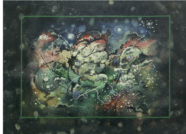
ე. ვახტანგშვილი - აბსტრაქციული კომპოზიცია

1910-იანი წლებიდან ქართულ მხატვრობაში ეროვნული მხატვრული ფორმის ძიებისა და დამკვიდრების პროცესი მიმდინარეობდა. ამ პერიოდში მოღვაწე ახალგაზრდა მხატვრები ევროპული ხელოვნების ტრადიციებს მასთან უშუალო კავშირის საფუძველზე ეზიარნენ – მათი დიდი ნაწილი ევროპის სხვადასხვა ქვეყანაში, ძირითადად კი პარიზში მოღვაწეობდა. მხატვართა შორის გაჩნდნენ ისეთი მნიშვნელოვანი და საინტერესო პიროვნებები, როგორებიცაა ვალერიან სიღამონ-