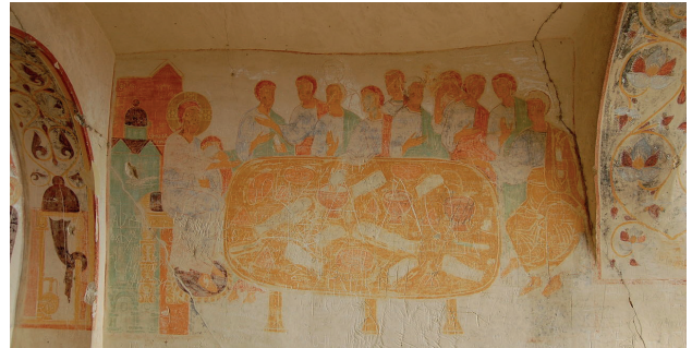
დავით ბარეჯა - უღაბნოს მოხატულობა

ამკობდა. მოზაიკა შემორჩენილი იყო მხოლოდ ფრაგმენტულად. აქ გამოსახული იყო ადრე ქრისტიანული ხელოვნებისათვის დამახასიათებელი კომპოზიცია „კანონის მიცემა“ – ცენტრში იესო ქრისტე გახსნილი გრაგნილით ხელში და მის ორივე მხარეს თითო მოციქული, სავარაუდოდ, პეტრე და პავლე. გრაგნილზე შემორჩენილ წარწერაზე იკითხება: „მე ვარ ნათელი, მე ვარ აღდგომა და სიცოცხლე. ის, ვისაც ჩემი სწამს, თუ მოკვდება, გაცოცხლდება“. კომპოზიციას ქვემოდან საკმაოდ ფართო და საინტერესო ფორმის მცენარეული ორნამენტი აჩარჩოებს. ამავე პერიოდში შექმნილი მსგავსი კომპოზიციები რომსა და რავენაშია შემორჩენილი. რომლებთან სიახლოვეს წრომის მოზაიკა ამჟღავნებს.